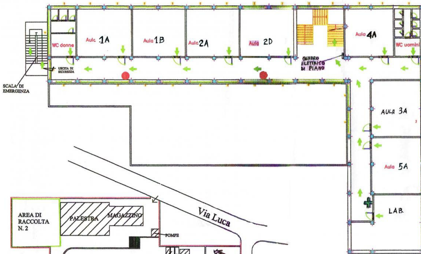
Pianta piano primo - Edificio Principale

Scala 1:100 I.T.S. "E. FERRARI" - CHIARAVALLE G.LE (CZ)